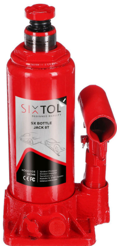
SX Bottle Jack 8T