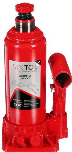
SX Bottle Jack 4T