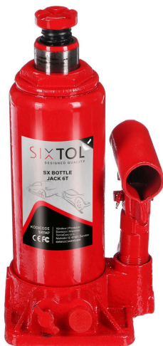
SX Bottle Jack 6T