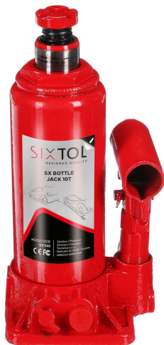
SX Bottle Jack 10T