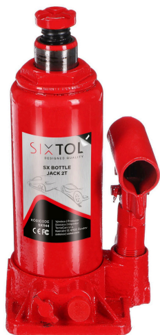
SX Bottle Jack 2T